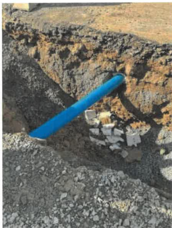
Obr.1 - pohled na vsunutou trubku menšího průměru

To jak vypadá současná oprava jednoho propustku, kterou si místní občané doslova vydupali, přikládám na přiložených fotografiích.