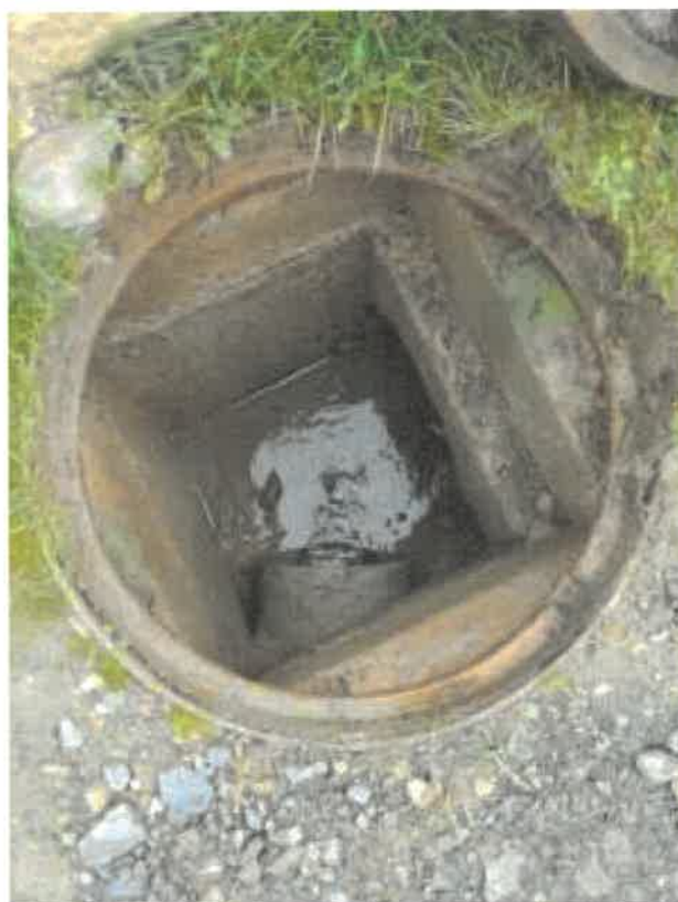
Obr. 3 - pohled na vyústění propustku do šachty

3) Bod, ke kterému jsme se již nedostali, protože jsem byl z daného KD doslova vypoklonkován.